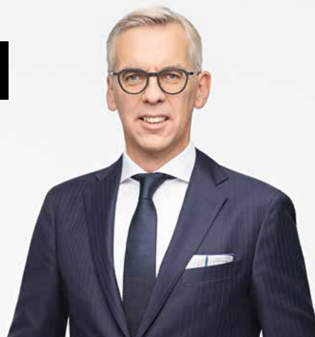
Ministre des Affaires intérieures